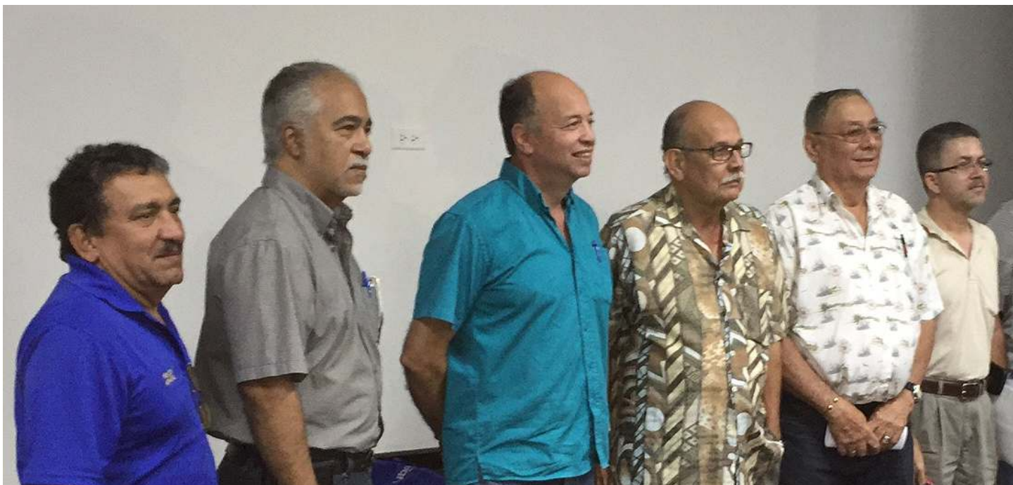
La nueva junta de directores del PR/VI VFC

Próximamente sabremos mas de este cambio ya que la nueva junta decidió publicar paginas independientes para beneficio de los trustees.